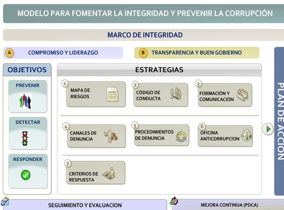
Figura 1: Propuesta de modelo de estrategia para fomentar la integridad y prevenir la corrupción