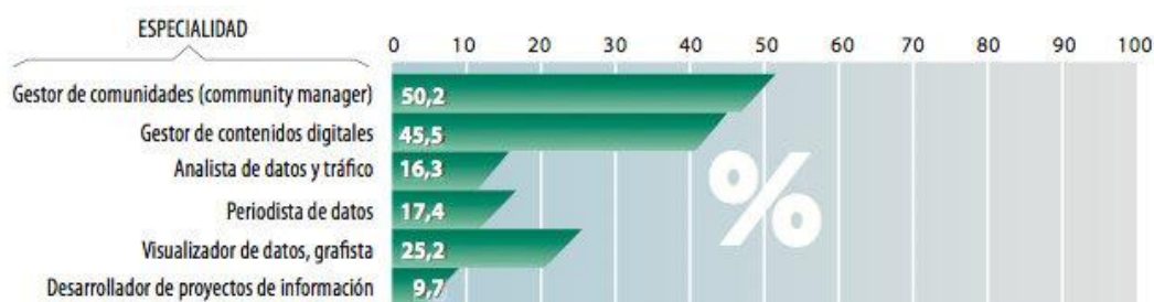
Nuevas especialidades en los medios españoles