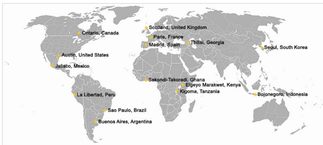
Gráfico 2. Gobiernos subnacionales dentro del programa piloto OGP