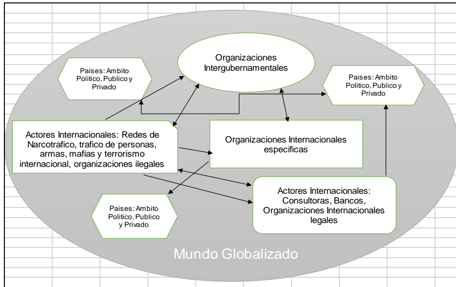
Grafico n° 2. Globalización de la Corrupción 1

Los elementos gravitantes en la globalización de la corrupción, es la maniobra de redes o mundos pequeños de corrupción xiii , los actores son diversos: