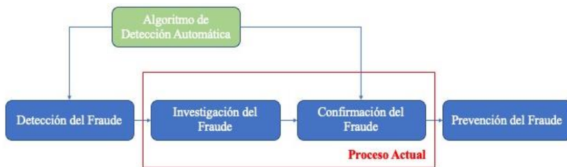
Figura 1. Ciclo del Fraude.